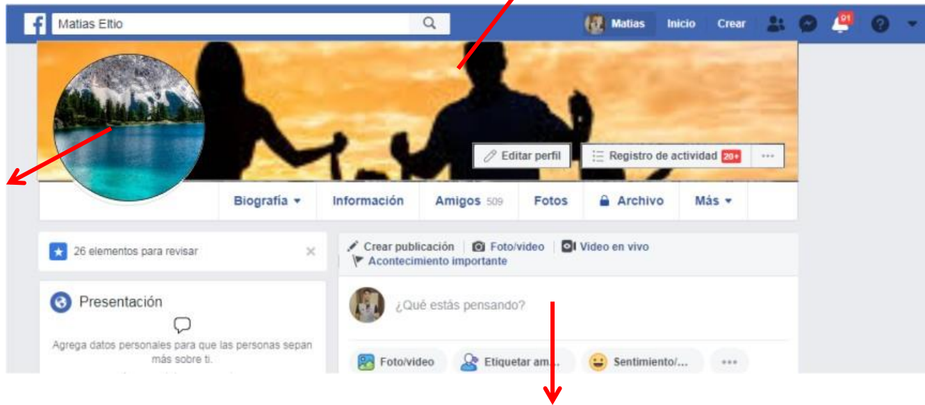
Foto de perfil

Estado: ¿que estás haciendo? ¿Que estás pensando? Se puede combinar texto con fotos